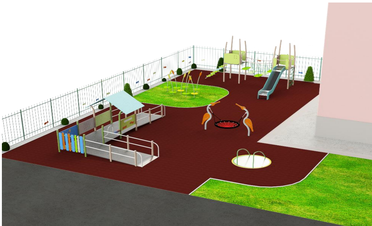
Miskolci látvány terv

2019 Pilot 4. Kisvárdra esetében (vázlattev, látványterv):