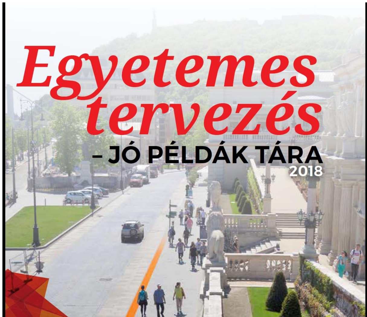
FOF2017, Jó Példák Tára, kiadvány borítója