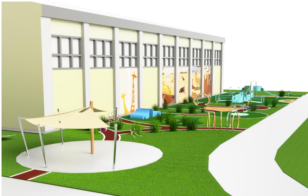
Kisvárdra látvány terv

A Játéknap Kft. tervezőjével elkészítettük az intézmény hátsó, sportpályákhoz kapcsolódó telekrészében kialakítandó a tematikus játszótér és pihenőpark vázlattevé és látványképeit. A terveket megküldtük az intézmény vezetőjének, akitől pozitív visszajelzést kaptunk, a fenntartó (egyház) megerősítése még folyamatban van.