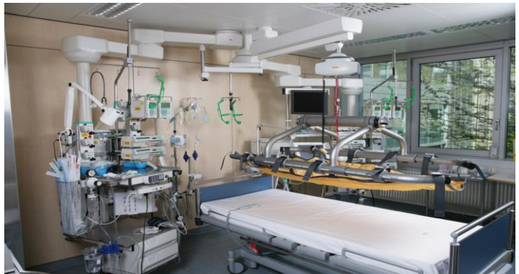
Emelőrendszer az intenzív osztályon