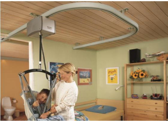
Egysínes személyemelő rendszer otthon