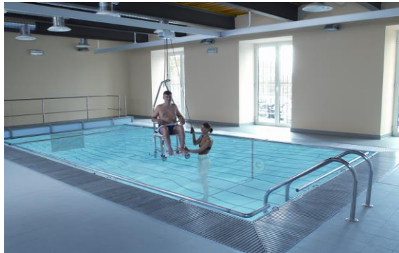
Alkalmazás a rehabilitációban, mozgásterápiában

A mennyezeti személyemelő rendszer mintegy 1,2 millió forintba kerül. Magyarországon jelenleg az egészségbiztosítási rendszer nem támogatja, pedig már akkor is megérné az államnak, ha csak az ápolást végzők egészségkárosodásának jelentős mértékű csökkenését nézzük – hangzott el az ülésen. A Guldmann emelőrendszereiről bővebben itt lehet tájékozódni: https://www.guldmann.com/