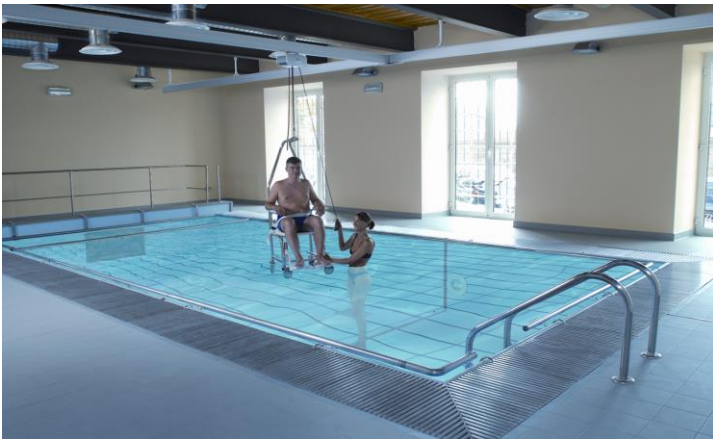
Alkalmazás a rehabilitációban, mozgásterápiában

A mennyezeti személyemelő rendszer mintegy 1,2 millió forintba kerül. Magyarországon jelenleg az egészségbiztosítási rendszer nem támogatja, pedig már akkor is megérné az államnak, ha csak az ápolást végzők egészségkárosodásának jelentős mértékű csökkenését nézzük – hangzott el az ülésen. A Guldmann emelőrendszereiről bővebben itt lehet tájékozódni: https://www.guldmann.com/