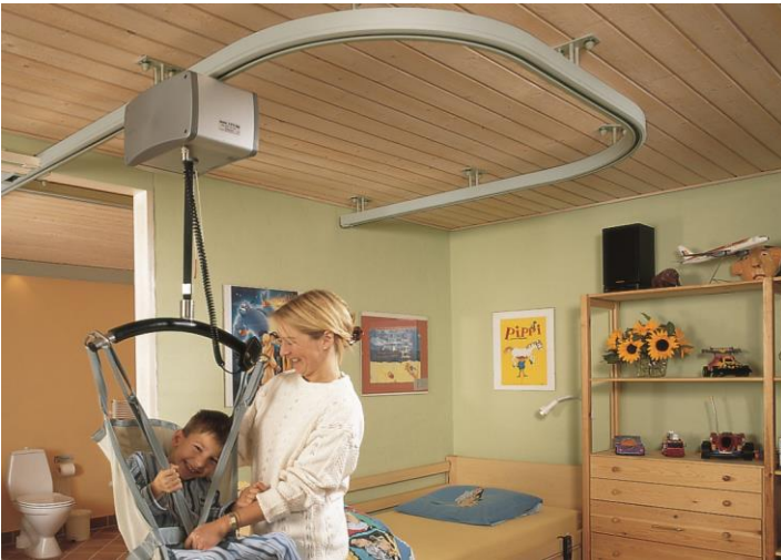
Egysínes személyemelő rendszer otthon