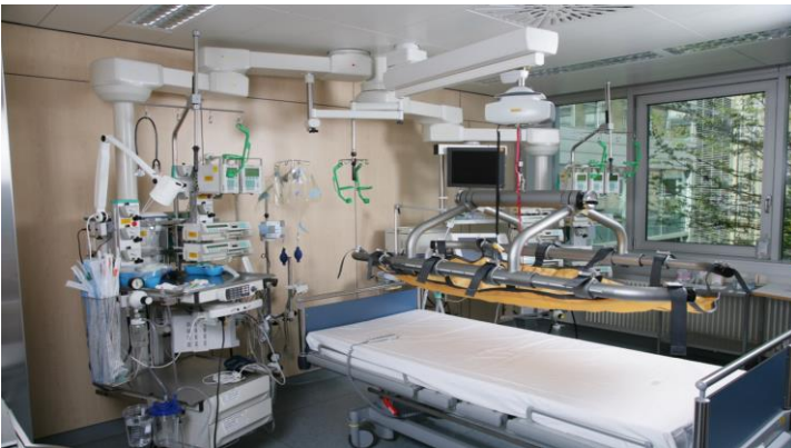
Emelőrendszer az intenzív osztályon