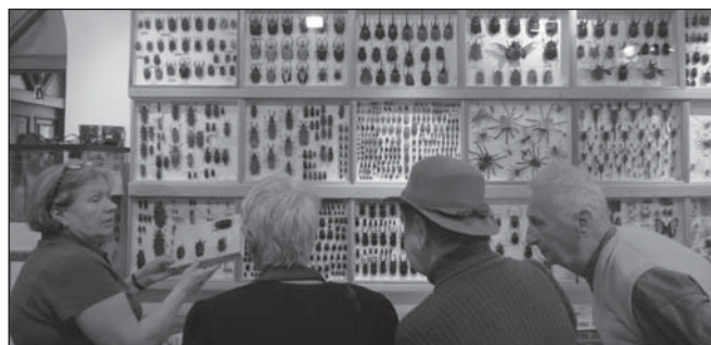
Az Újpesti Lepkemúzeumban

Újpesti szervezetünk a helyi Lepkemúzeumban tett látogatást, és a gyógyvizéről híres Hajdúszoboszlóra látogatott el, de disznótoros programon is részt vettek Mezőkövesden, adventkor pedig Mariazellbe kirándultak.