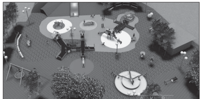
Egyetemesen tervezett játszótér látványterve