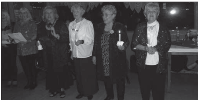
Újpesti szervezetünk karácsonyi ünnepsége

Klubjaink minden jeles ünnepen összejönnek, karácsonyra ünnepséget szerveznek és lehetőség szerint szerény csomagot is osztanak a tagoknak. Segítenek a szociális ügyek intézésében, ellátásokkal, lakás-akadálymentesítéssel, gépjárműszerzéssel, mozgássérült személyek parkolásával kapcsolatos ügyekben.