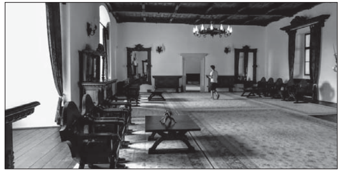
A Fogarasi vár díszes terme

A székesegyház megtekintése után egy teraszon megpihelve fagyalattal, üdítővel hűsítettük magunkat. Délután Fogarasba értünk. A fogarasi vár többfunkciós: könyvtár és hotel mellett történelmi és népművészeti múzeumnak is otthont ad. Ez utóbbit meg is tekintettük.