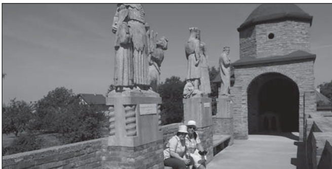
Kirándulás a Bory-várban

Kőbányai szervezetünk Székesfehérvári városnézésen vett részt, jártak a Bory-várban, a kiskunhalasi Csipkeházban és a türkevei termálfürdőben.