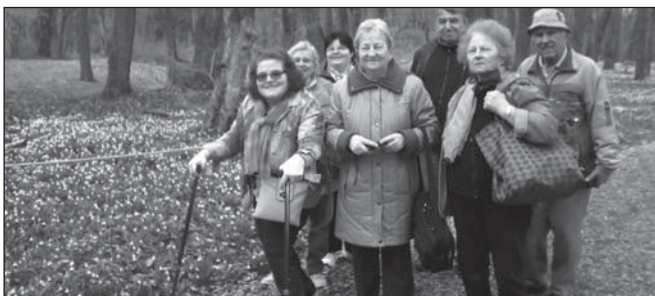
Séta az alcsúti hóvirágmezőn

Békásmegyeri csoportunk minden évben Párkányba kirándul. Lőrinci szervezetünk megemlékezett az Arany- és a Kodály évfordulóról, ellátogatott a Dohány utcai Zsinagógába és a Parlamentbe, az alcsúti hóvirágmezőre, a Nagytétényi kastélyba, a Fővárosi Állat- és Növénykertbe, a Fővárosi Nagycirkuszba, a leányfalui termálfürdőbe és közös bográcsozást is szerveztek.