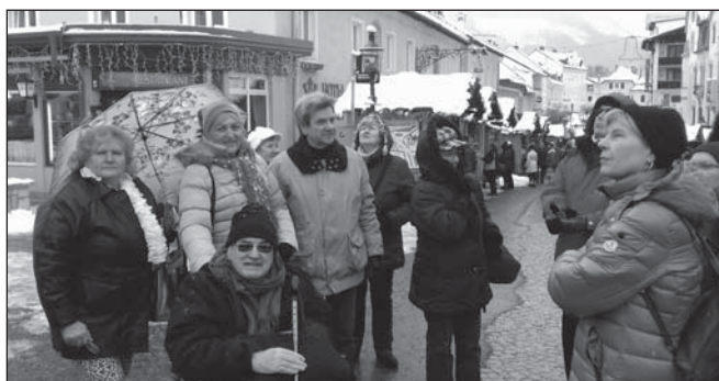
Adventi kirándulás Mariazellbe