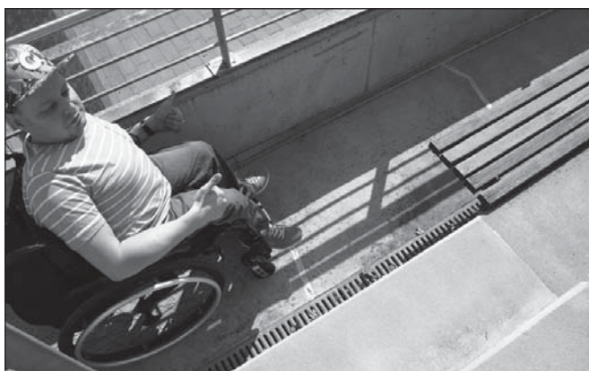
Helyszíni bejárás az ETIKK csapata

auditok során a Központ helyszíni bejárásokat és tervelemzéseket végzett felhasználói tesztcsoporttal és szakmérnöki vezetéssel. Vizsgálta továbbá a Volánbusz, a Budapesti Közlekedési Központ (BKK) és a MÁV szolgáltatásainak akadálymentességét.