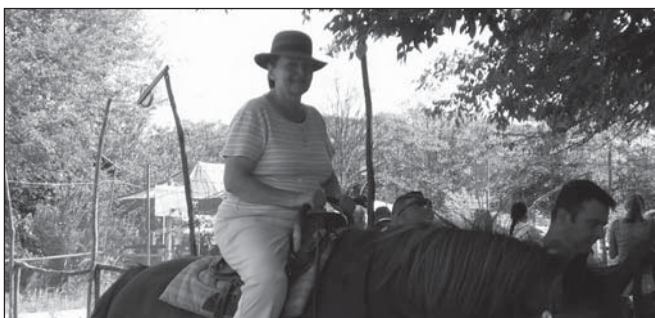
Kerületi szervezeteink rendszeresen ellátogatnak az akadálymentes Velo tanyára, ahol lovaglásra is van lehetőség